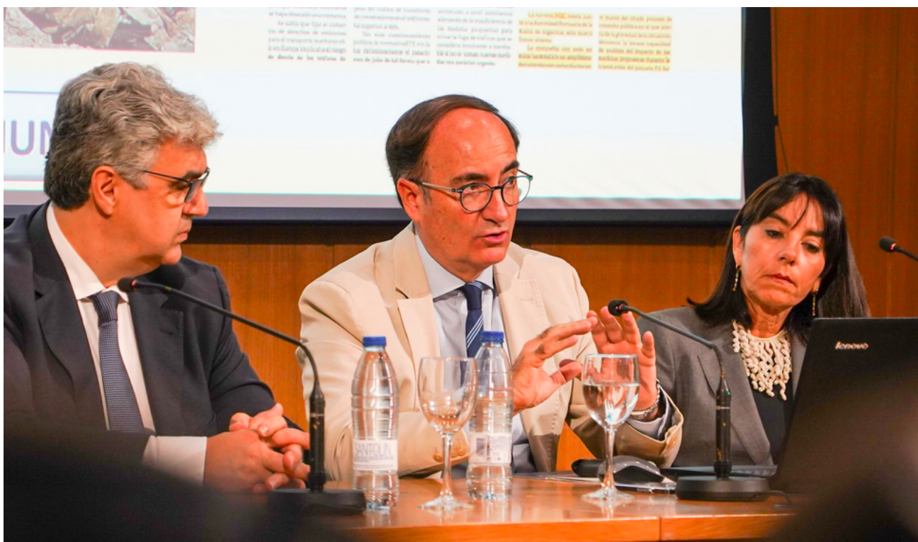
Celebración del XXI Congreso de la Asociación Andaluza de Profesores de Derecho Mercantil "Sainz de Andino"