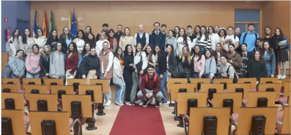
Seminario Permanente de Derecho Penitenciario