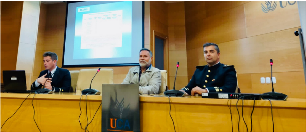
Jornada salidas profesionales en las Fuerzas Armadas (17/03)