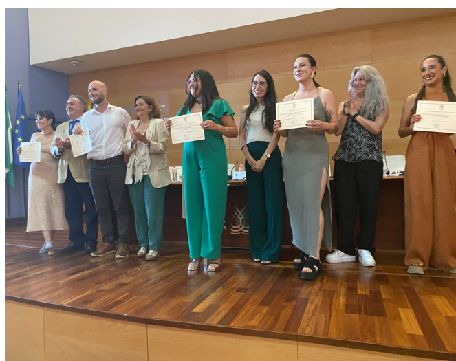
Actos de clausura de Másteres que se imparten en la Facultad de Derecho