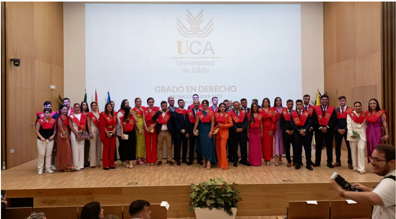
Actos de graduación en Algeciras de los Grados que se imparten en nuestra Facultad