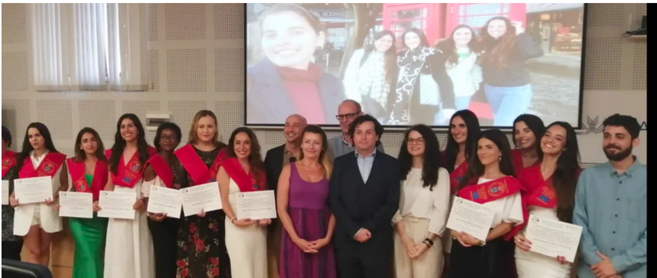
Acto de clausura de del Máster bilingüe en Relaciones Internacionales y Migraciones